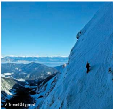
V Travniški grapi