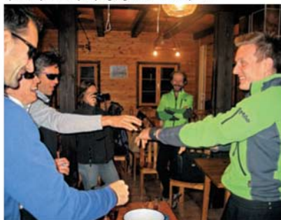
Tudi lepota je pomembna.