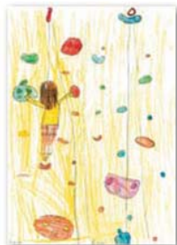
Kaja in Ema Resnik