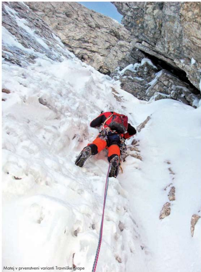
Matej v prvenstveni varianti Travniske grape