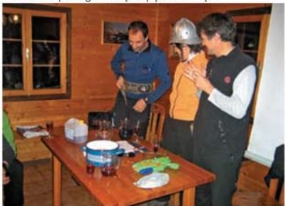
Vprašanja za najboljšega gasilca med alpinisti