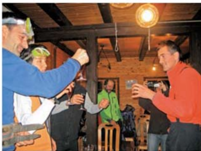
V hribu zna pomagati tudi potapljaško znanje.