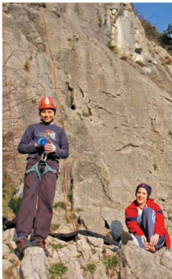
Pod osapsko steno

meškem. Se bomo pa potrudili nadoknadiť zamujeno s skupnimi turami.