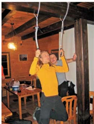
Marjan je car.