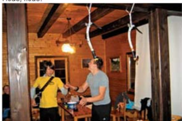
Kdo je močnejši?