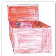
Nik Krhen, 13 let

To leto hodim na plezanje prvič in mi je zelo všeč. Gre mi dobro. Veliko mi pomaga sošolka. Všeč je tudi mojemu bratcu. Še posebej igra na drugi polovici telovadnice. Tudi nje-