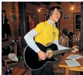
Ena od Mi2