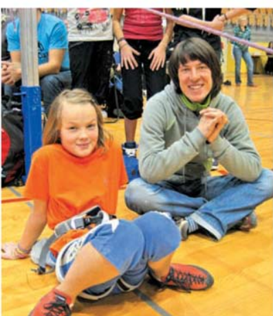
Tekmovalka in trener