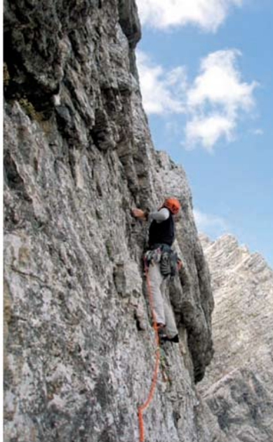
Peternelova v Steni

Zelo rad imam skalo, predvsem dolge konkretne smeri in kompaktno skalo. Lanski Meč mi ni ostal v najlepšem spominu. Pozimi pa mi je v užitek kakšen trd graben, pa da imam dilce s sabo in potem v sončku odsmučam v dolino. Upam, da bom to pomlad še uspel po Slovenski gor