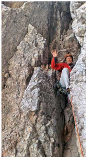
V tesnem kaminu