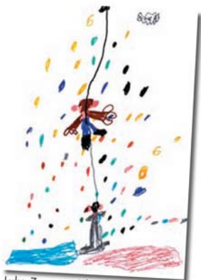
Luka Zupanc, 6 let