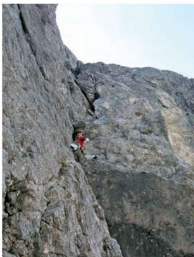
V najtežjem raztežaju Ašota

Pri delu na klubu me vodi neka moralna zaveza do soljudi. Da sem sam zašel v ta prečudoviti svet gora, se imam zahvaliti prečudovitim vodnikom in mentorjem PD Bohor in mislim, da je prav, da se tudi mi na klubu potrudimo, da omogočimo mladim, da spoznajo gore ali pa da spozna-