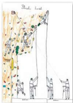
Nik Krhen, 13 let